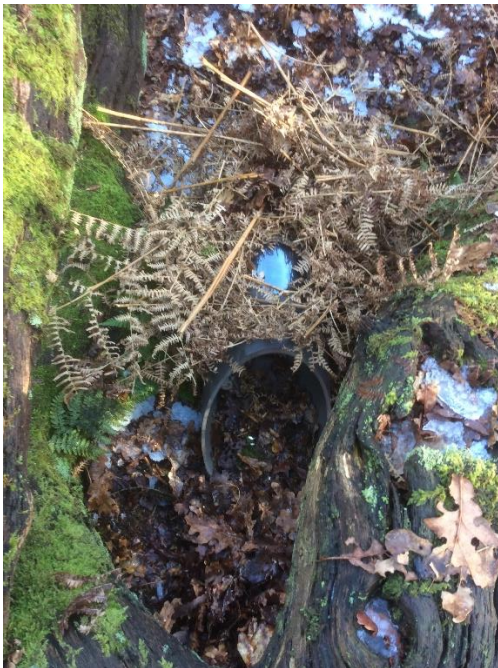
Struikrover ® in het veld

Matthijs heeft uitgebreid onderzoek gedaan met de struikrover ® , resultaten zullen gepubliceerd worden. Als je de ontwikkelingen wilt volgen, kijk dan regelmatig op zijn facebookpagina.