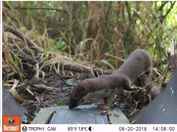
Wezel @Matthijs Smaal