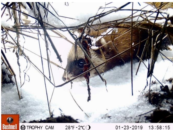
Bunzing @Matthijs Smaal