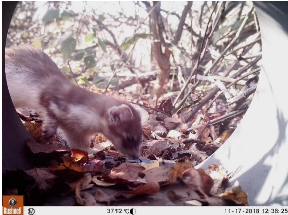
Hermelijn in overgangskleed

De struikrover ® onderscheidt zich door het feit dat er ook andere dieren worden waargenomen dan Wezel en Hermelijn. De buis is van PVC, licht in gewicht en onopvallend. De struikrover ® wordt geleverd inclusief een speciale, door de leverancier aangepaste Bushnell Agressor . Deze camera is geselecteerd op zijn bouw, reactiesnelheid en kwaliteit van de beelden. De Agressor is nagenoeg geruisloos en produceert (infrarood)flitslicht, waar dieren niet van schrikken. De camera kan ook in de filmstand worden gebruikt maar dan is de reactietijd langer.