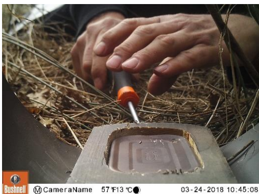
Positie gaatje in blik